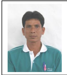
หมู่ที่ ๗

อาสาสมัครเกษตรหมู่บ้าน ตำบลเขาเจ็ดยอด อำเภอทับคล้อ จังหวัดพิจิตร ๒๒๒๒๒๒๒๒๒๒